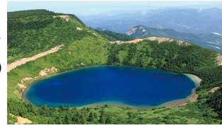
<見たかった美しい「魔女の瞳」>

しかし、晴れた日の美しい「魔女の瞳」を拝みたいため、再チャレンジすることを心に誓い、山頂を後にしました。