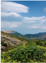
<晴れていれば絶景>

お問合せ・ご相談は・・・ TEL:025-286-1424 FAX:025-287-0065