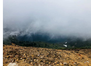
<一瞬だけ見えた「魔女の瞳」>