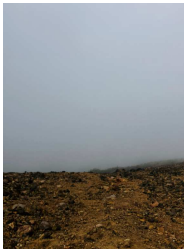
<山頂の全景> 何も見えません…