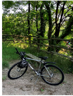
<30年前に購入した自転車>

傍(はた)から見れば、それはまさに生まれたての小鹿状態。改めて運動不足の烙印を押された休日となりました。